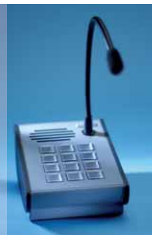
Die Digitale Sprechstelle kann sowohl Audio- als auch Steuerungssignale digital übertragen