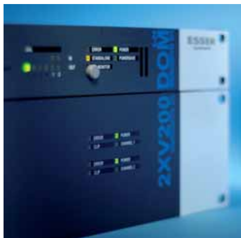
Die VARIODYN® D1-Systemkomponenten überzeugen mit ansprechendem Design und intuitiver Bedienbarkeit

ein umfangreiches Produktportfolio für unterschiedlichste Einsatzgebiete zur Verfügung – von digitalen Sprechstellen über Leistungsverstärker bis hin zum kompakten Komplettsystem.