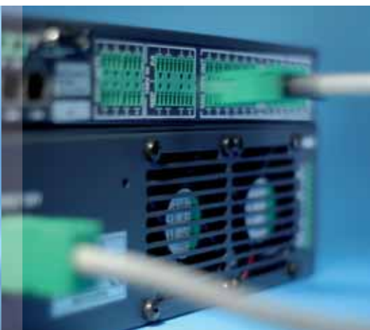
Installation nach dem „plug and play“-Prinzip: SAA-Systeme von ESSER lassen sich ohne aufwändige Verkabelung einfach per Stecker anschließen